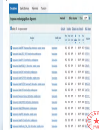
Figure 1. NCBI Database BLAST Results